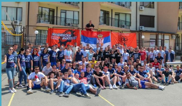
Студентски дом (најповољнији смјештај)