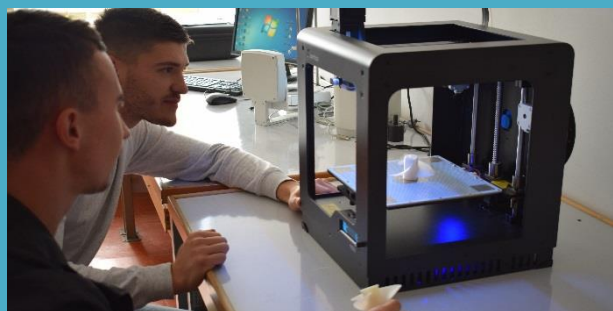
Савремени концепт наставе