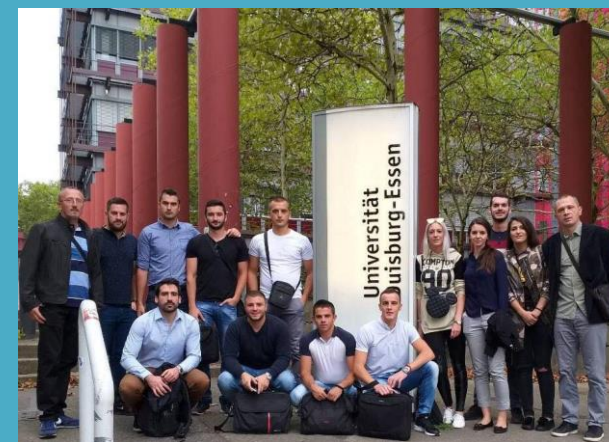
Студенти МФ у посјети Универзитету Дуисбург-Есен

Машински факултет је добитник признања од Министарства науке и технологије као најбоља научно-истраживачка институција Републике Српске у 2017. години.