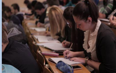
Савремени концепт наставе